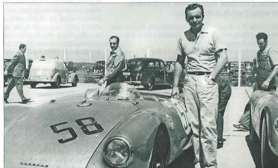
Na základě Juhanova úspěchu v závodech La Carrera Panamericana získaly nejsportovnější modely Porsche označení Carrera