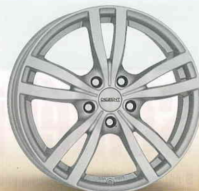
DEZENT TC 15", 16", 17"