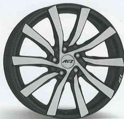
AEZ Reef/Reef SUV 17", 18", 19"/19", 20"