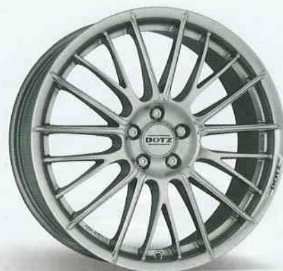
DOTZ Rapier shine 16", 17", 18"