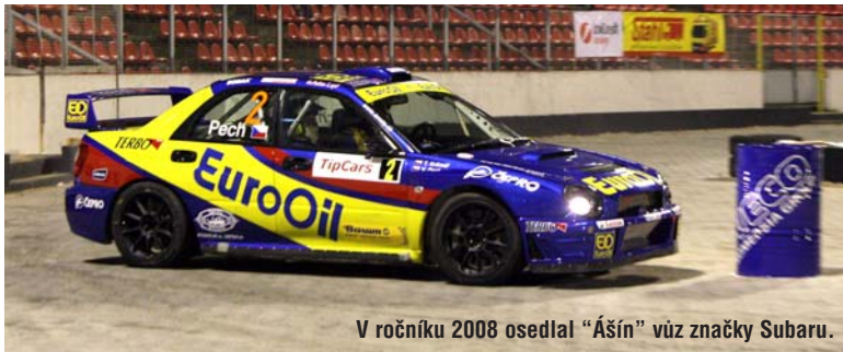
V ročníku 2008 osedlal "Ášín" vůz značky Subaru.

V POSLEDNÍM LISTOPADOVÉM VÍKENDU 1995 TO VŠE ZAČALO. LETOS PRAŽSKÝ RALLYSPRINT SLAVÍ SVÉ DRUHÉ KULATINY.