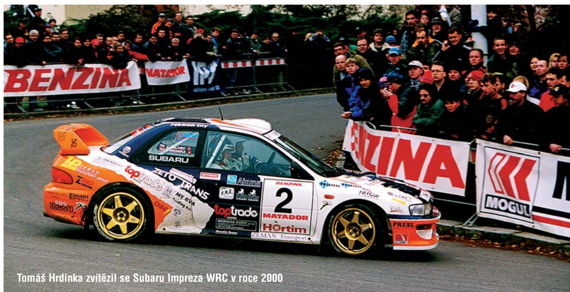
Tomáš Hrdinka zvítězil se Subaru Impreza WRC v roce 2000

Další informace o TipCars Pražském Rallysprintu se dozvíte na webových stránkách www.prazskyrallysprint.cz nebo na facebookovém profilu.