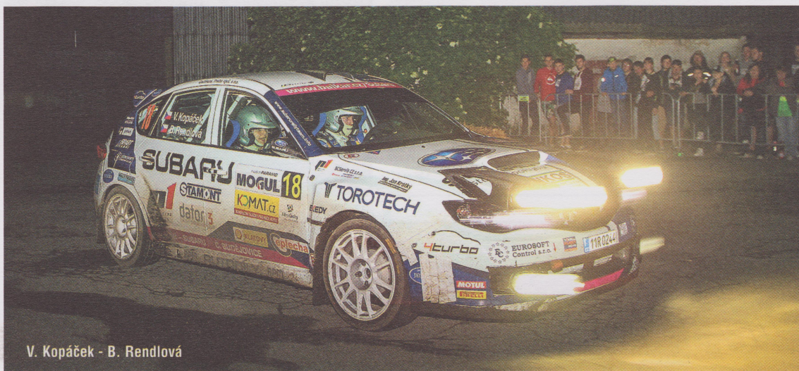
V. Kopáček - B. Rendlová