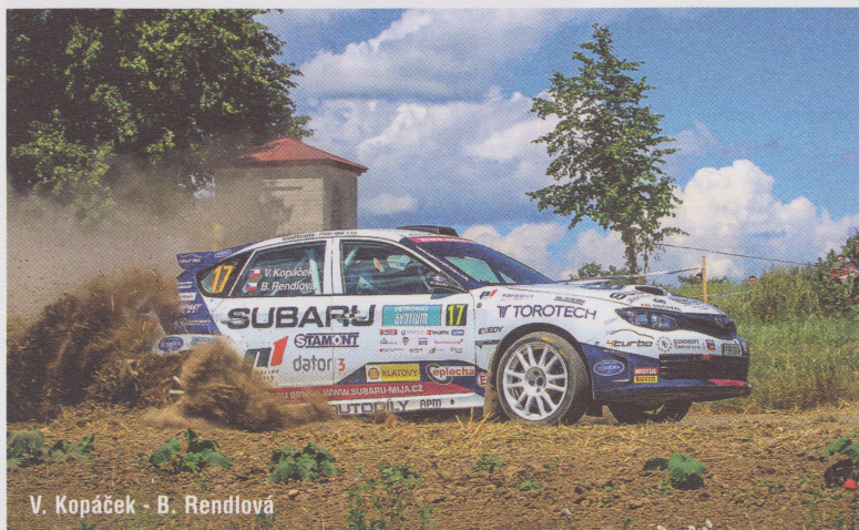
V. Kopáček - B. Rendlova

Václav Kopáček s Barborou Rendlovou před začátkem sezony nahradili u Subaru ČR odcházejícího Vojtěcha Štajfa a jejich cíle byly pochopitelně nejvyšší. Snahou bylo poskočit o stupínek výše v porovnání se sezonou 2015 a získat titul šampiónů třídy 3. A úvod sezony vyšel mladé posádce náramně. Na klatovské Rally Šumava jejich modrobílé Subaru Impreza WRX STI dlouho vévodilo produkční kategorii a až sobotní potíže s diferenciací způsobily jejich propad na třetí příčku. Navíc následující Rally Český Krumlov dopadla ještě lépe. Ač soutěži nepřálo počasí, západočeská dvojice využila těžkých podmínek, které Subaru svědčí, k premiérovému letošnímu triumfu. "Po proslulém českobudějovickém prologu jsme nemohli uvěřit, jaké peklo se odehrávalo v okolí Českého Krumlova. Čekaly nás místy podmínky, které by se daly snad lépe než v autě zvládnout plavbou kraulem, tedy pokud by přítom člověk přežil bombardování tak velkými kroupami. Základním úkolem se tak pro nás stalo dojetí do cíle," vzpomíná Václav Kopáček. To se nakonec podařilo, navíc vítězně!