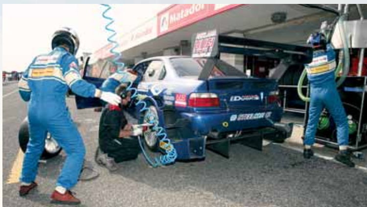
TANEC MECHANIKŮ BĚHEM PITSTOPU BMW DUCK RACINGU