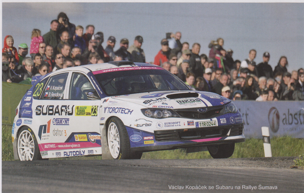
Václav Kopáček se Subaru na Rallye Šumava

Je to z mého pohledu lepší okruh, ale zase je škoda že už se nejedí na tom původním se šikanou po startu, Boschovou zatáčkou a dalšími atraktivními místy. Současná trať