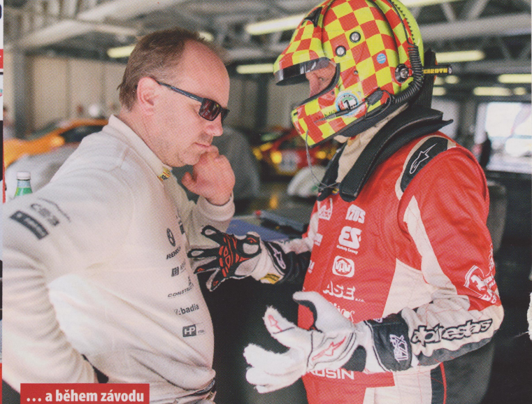
... a během závodu