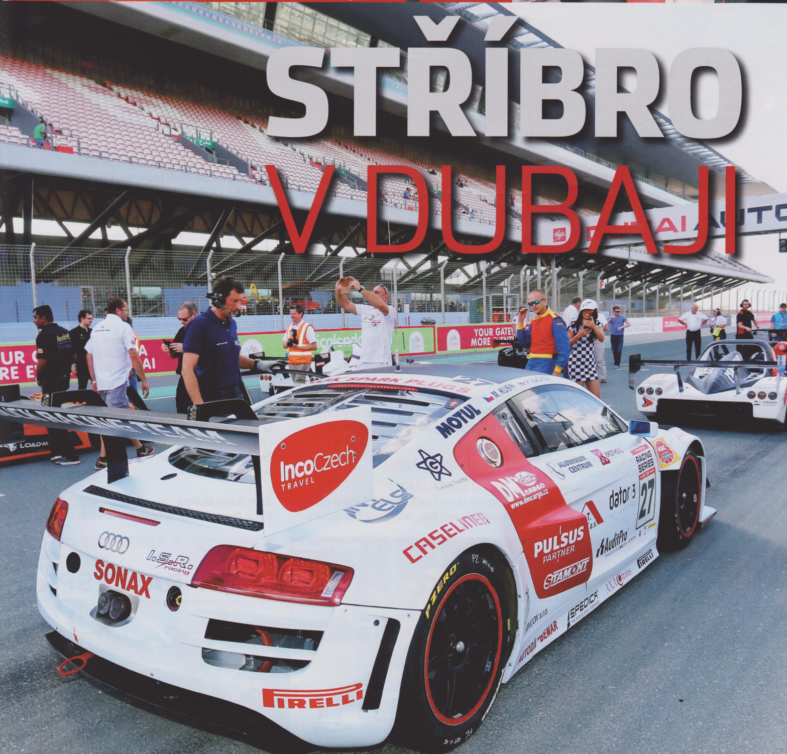
Na startu dvouhodinového závodu na autodromu v Dubaji