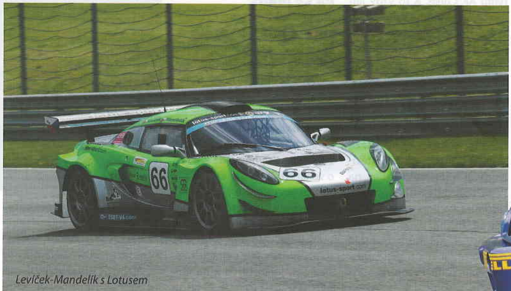
Leviček-Mandelík s Lotusem

ším oživením poháru je nově vypsaná třída Touren Wagen Cup pro pohárové cestovní vozy do dvou litrů. A stejně jako loni se ESET V4 Cup může pochlubit mediální podporou i ze strany našeho časopisu. Krize sice zažehnána není,