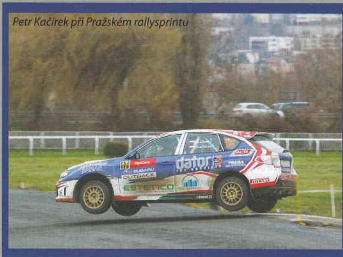
Petr Kačířek při Pražském rallysprintu

Poprvé se tato soutěž uskutečnila v roce 1950 a byla vlastně