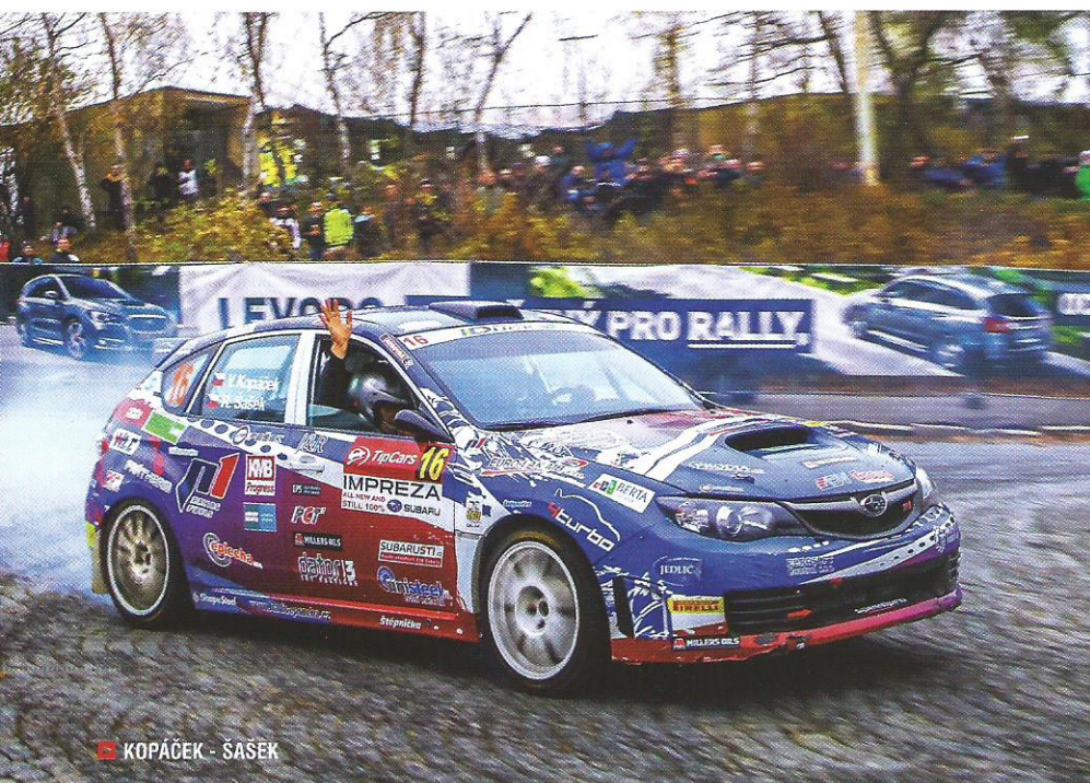
KOPÁČEK - ŠAŠEK